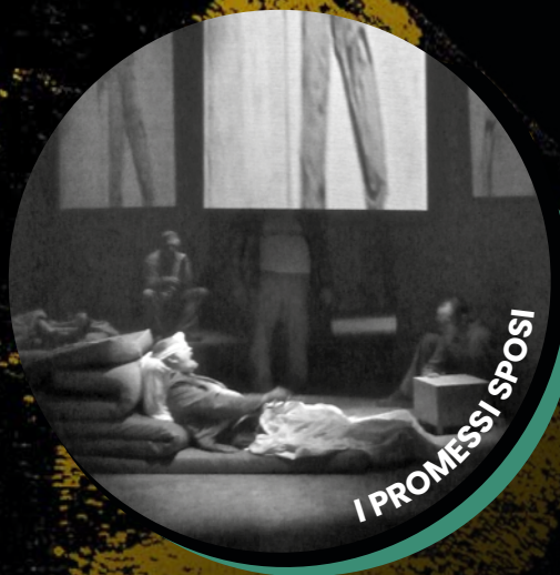
I PROMESSI SPOSI